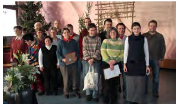
Bei der traditionellen Abzeichenverleihung ehrte die Lebens- und Arbeitsgemeinschaft Lautenbach langjährige Mitarbeiter.