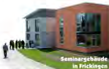
Seminargebäude in Frickingen

Tel.: 07552 / 262 - 0 Fax: 07552 / 262 - 109