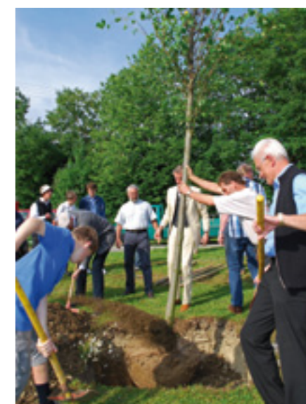
Die Dorfgemeinschaft Lautenbach feiert 40. Geburtstag. Der Freundeskreis pflanzt zum Jubiläum zwei Sommerlinden als Dankeszeichen.