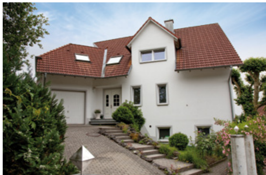
Im Jahr 2005 wurde das Wohnprojekt „Begleitetes Wohnen“ in Überlingen realisiert.