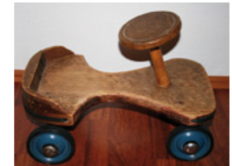
Zimmerauto Baujahr 1979

Mit dem 40-jährigen Bestehen der Lebens- und Arbeitsgemeinschaft Lautenbach feiern auch die Lautenbacher Produkte ein Jubiläum: Sie werden seit vier Jahrzehnten weit über die Grenzen der Region hinaus verkauft und erfreuen sich eines wachsenden Interesses.