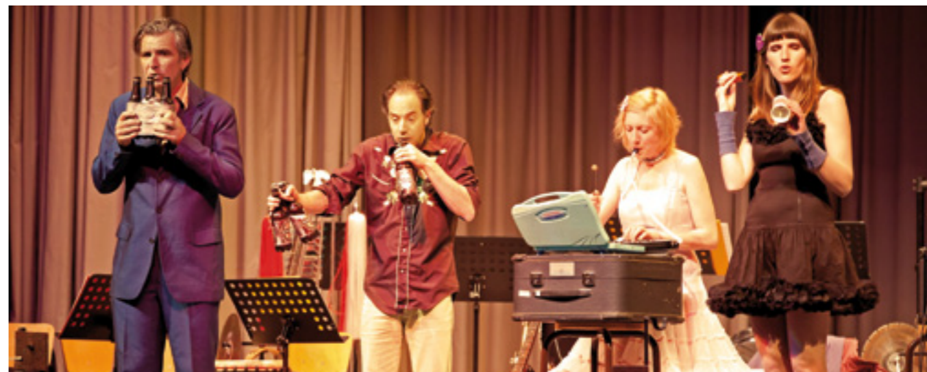
Die Blaskapelle bot gemeinsam mit „The Beez“ einen tollen Vorgeschmack auf das Kulturfestival „Kufe 12“, das im nächsten Jahr stattfindet.

Man darf gespannt sein, was „Kufe 12“ im nächsten Jahr bringt. Der Vorgeschmack jedenfalls war schon mal Klasse.