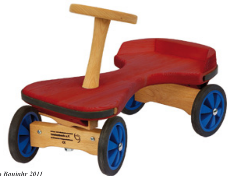
Zimmerauto Baujahr 2011