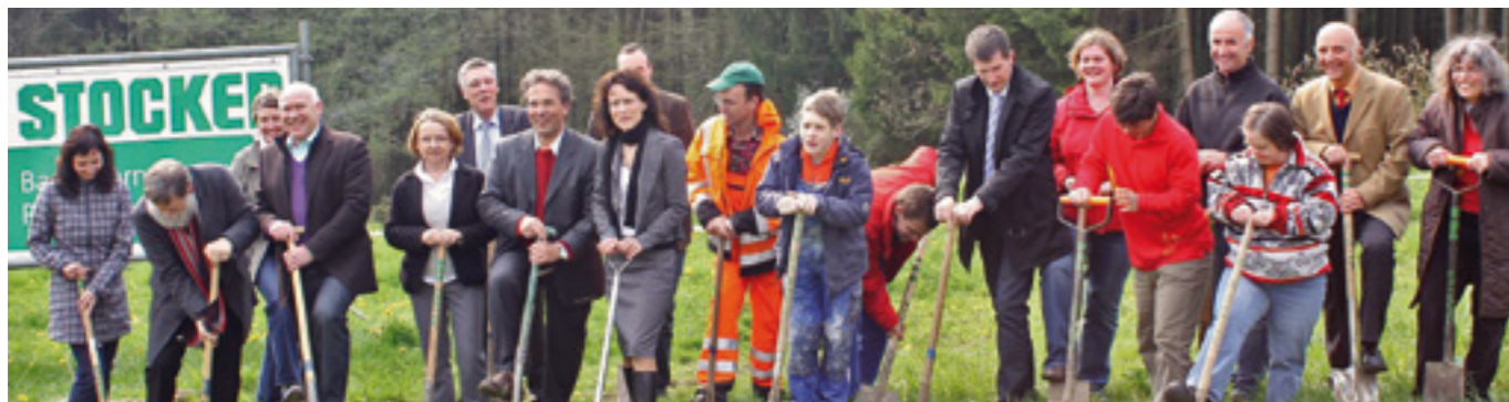
Ein Grund zur Freude für die Lautenbacher: Mit dem offiziellen Spatenstich starteten im April die Baumaßnahmen für die beiden neuen Wohngebäude „Haus am Wald“ und „Haus am Kirschbaum“.

Über 150 Menschen mit Behinderung leben in der Lebens- und Arbeitsgemeinschaft Lautenbach. Dazu kommen fast ebenso viele Betreuer und Mitarbeiter. Eine stattliche Gemeinschaft, die sich in den letzten 40 Jahren – so alt wird Lautenbach heute – aus den Anfängen im Brunnenhof entwickelt hat und jetzt ein zukunftsweisendes Projekt auf den Weg bringt. In den neuen Wohngebäuden „Haus am Wald“ und „Haus am Kirschbaum“ entstehen 40 Wohnplätze für die betreuten Menschen. Mit dem offiziellen Spatenstich gingen die 3,2 Millionen Euro teuren Baumaßnahmen im April an den Start.