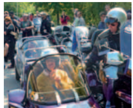
Der Besuch der Motorradgespanne ist bereits beste Tradition und für die betreuten Menschen immer wieder ein schönes Erlebnis.