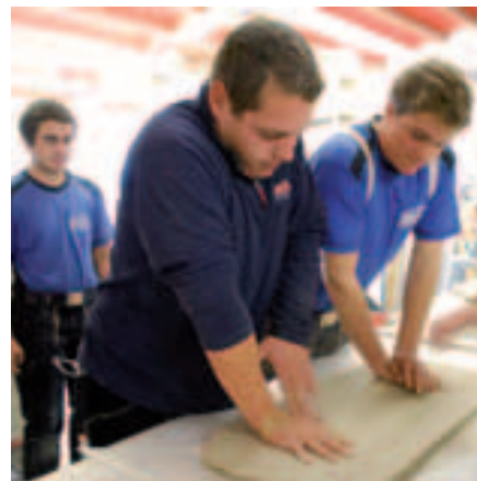
Mitarbeiter von Holzbau Künstle hinterlassen ihren Handabdruck in Ton.

Deckblatt, persönlichem Text und Firmen-Logo. Es freut die Lautenbacher sehr, wenn sie auf diese Art und Weise unterstützt werden, „Herzlichen Dank!“ sagen sie an die Firma Künstle für ihr Engagement.