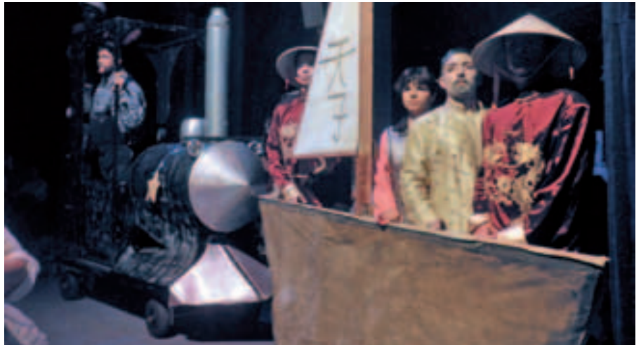
Die Theatergruppe führt in Lautenbach die spannende Geschichte von Jim Knopf auf.

Jim Knopf und Lukas müssen ihre Heimatinsel Lummerland verlassen und gelangen nach China, wo sie erfahren, dass des Kaisers Tochter Li Si entführt worden ist und im Inneren eines Vulkans gefangengehalten wird. Nach aufregender Fahrt durch die Wüste wagen sie sich in die Stadt der tausend Drachen und befreien am Ende tatsächlich Li Si und alle anderen Kinder aus der Gefangenschaft von Frau Mahlzahn. Dass nur einer der Retter die schöne Li Si heiraten