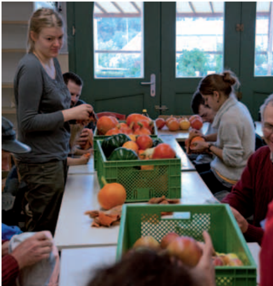
Eine der Aktivitätsgruppen befasste sich mit der Vorbereitung des Erntedankfestes.