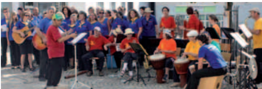
Begegnung zwischen behinderten und nicht behinderten Menschen, wie sie bei der Podiumsdiskussion am Vorabend gewünscht wurde, lockte zahlreiche Besucher auf den Pfullendorfer Marktplatz.