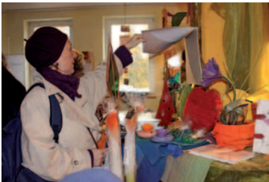
Die handwerklich gefertigten Produkte stießen beim Lautenbacher Herbstmarkt wieder auf großes Interesse.