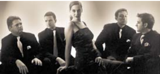
Die Tangogruppe „Las Sombras“ begeistert die Lautenbacher mit ihrem neuen Programm.

Einen ganz besonderen Abend durfte die Lebens- und Arbeitsgemeinschaft Lautenbach im April erleben: Die Tangogruppe „Las Sombras“ präsentierte zum ersten Mal ihr neues Programm „Die elf Tangos des Monsieur Arnault“. Für die Gruppe war es eine Vorpremiere, für Lautenbach ein Geschenk von besonderer Qualität.