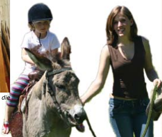
Auf dem Rücken eines Esels drehten die kleinsten Besucher gern ihre Runden.