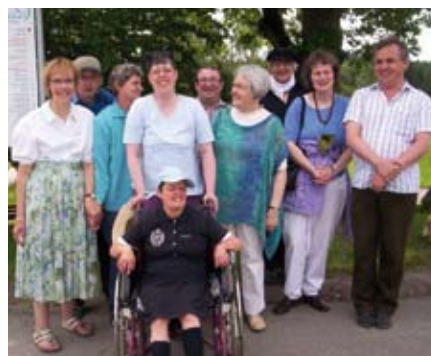
Erinnerungen aus der gemeinsamen Schulzeit wurden ausgetauscht.

Zum Auftakt des Klassentreffens besuchten die Teilnehmer das Konzert des Voith-Orchesters, das im Wilhelm-Meister-Saal gastierte. Anschließend gab es einen Brunch in einem Klassenzimmer, wo festlich eingedeckt worden war. Alle freuten sich über das Wiedersehen und tauschten Erinnerungen aus der gemeinsamen (Schul-)Zeit in Lautenbach aus. Anschließend gab es einen kleinen Rundgang durch das Dorf, während sich