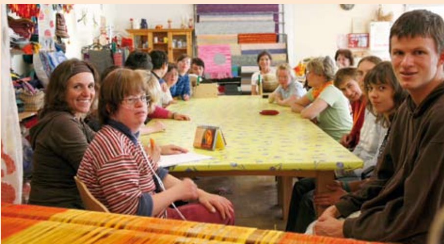
Nach kreativer Arbeit versammelt sich das Weberei-Team um den Werkstattstisch.

Wenn die Weberei-Gemeinschaft zum Abschluss und Rückblick auf einen intensiven Arbeitstag sich um den großen Werkstattstisch versammelt, ist es erstaunlich, dass alle noch einen, wenn auch knapp bemessenen Platz finden. Dabei haben wir erst im Frühjahr zwei größere wunderbar stabile Tische in der Schreinerei bauen lassen.