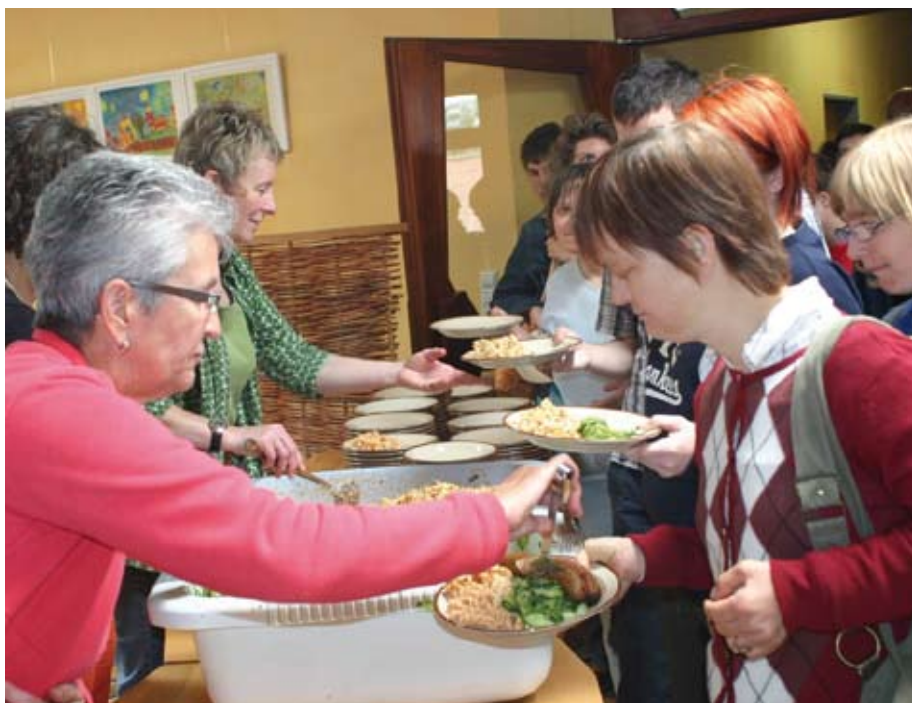
Einer der Höhepunkte beim Lautenbacher Betriebsfest: das gemeinsame Mittagessen. Die Frauen aus der Verwaltung übernahmen in diesem Jahr die Aufgabe, den über 300 Mitarbeitern das Essen zu schöpfen.

Zu den festen Ritualen im Jahreskreis der Lebens- und Arbeitsgemeinschaft Lautenbach gehört das Betriebsfest. Auch in diesem Jahr ruhte die Arbeit im Dorf wieder für einen ganzen Tag, um gemeinsam zu feiern.