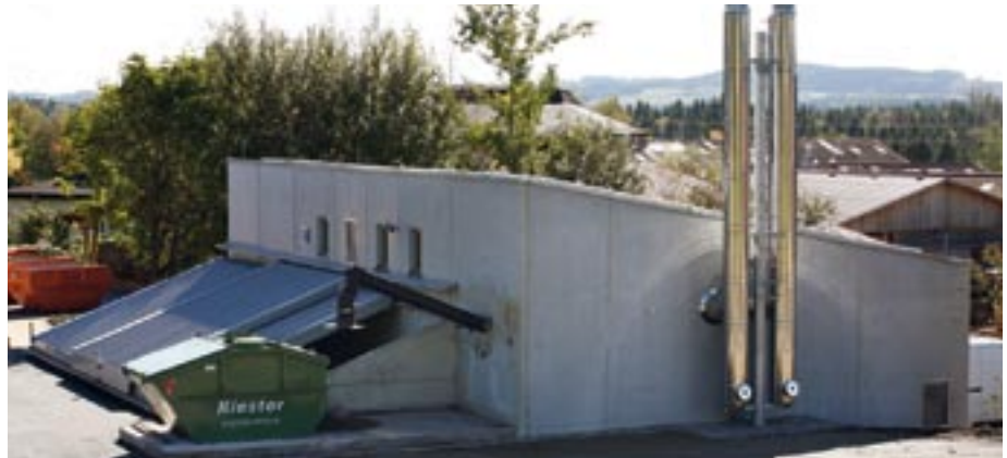
Die Holzhackschnitzelanlage ist bereits erfolgreich im Einsatz.