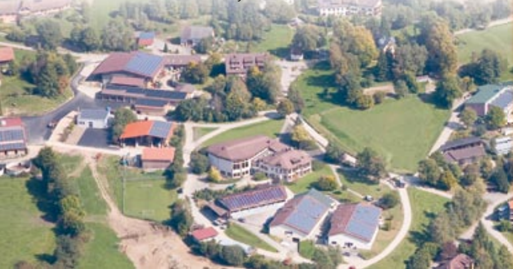
Abb. unten: Viele Solarzellen schmücken jetzt Lautenbachs Dächer.