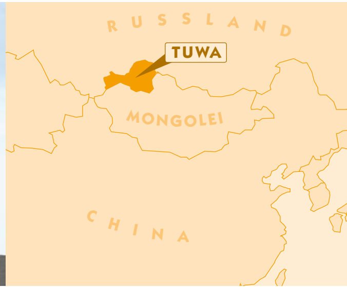
Das Alash-Ensemble aus dem asiatischen Gebirgs- und Steppenland Tuwa.