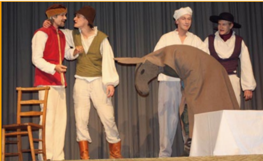
Die Theatergruppe der Heilstätte „Sieben Zwerge“ brachte das Märchen „Tischlein deck dich“ in einer modernen Form auf die Lautenbacher Bühne.

Kultur hat in der Lebens- und Arbeitsgemeinschaft Lautenbach einen hohen Stellenwert. In regelmäßigen Abständen gibt es für die Bewohner, aber auch für Gäste Aufführungen auswärtiger Künstler. Mitte November brachten die „Sieben Zwerge“ das Märchen „Tischlein deck dich“ auf die Lautenbacher Bühne.