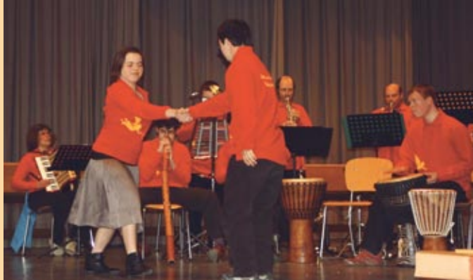
Ein Auftritt der Lautenbacher Blaskapelle, die erstmals von zwei Tänzern verstärkt wurde, durfte bei der Angehörigentagung nicht fehlen.