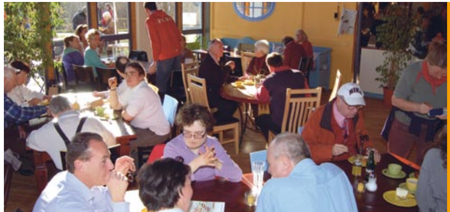
Kleine Pause im behaglich eingerichteten Café.

den: kunstvoll Gewobenes, feine Keramik, Holz- und Metallspielzeug, Papier- und Lederwaren, Bodensee-Tee aus eigenen Kräutern, individuell gestaltete Kachelöfen, Kerzen aus echtem Bienenwachs, Kalender und Bücher. Viel zu tun hatten die Kassenmitarbeiter, denn viele Produkte eigneten sich hervorragend als Weihnachtsgeschenk.