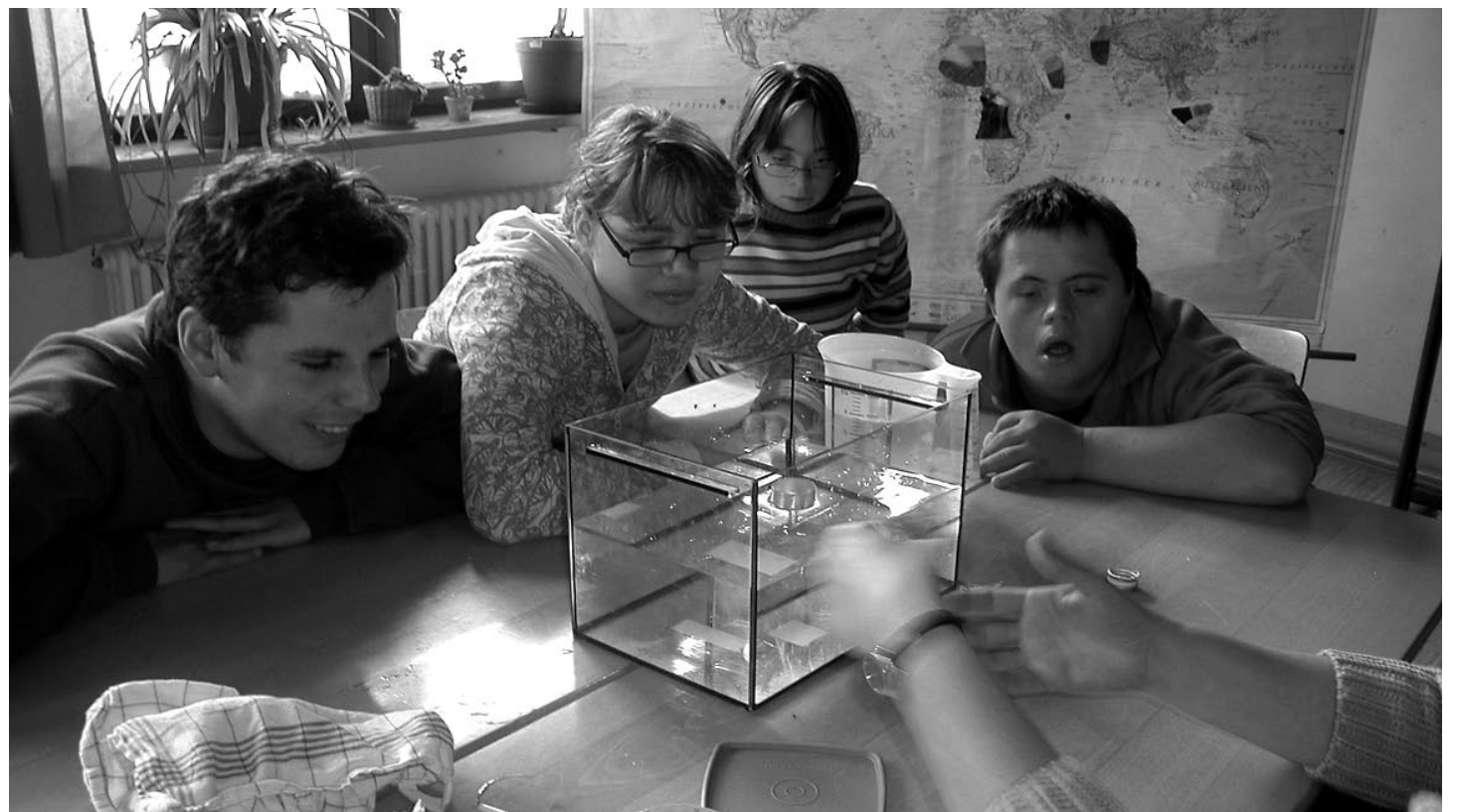
Was schwimmt und was sinkt, erforschte eine Schülergruppe während der Projekttage, die das Thema »Schiff« zum Inhalt hatten.

wechslungsreichen Projekttagen, die mit viel Spaß verbunden waren. Sie hatten alles geschafft, was sie sich vorgenommen hatten.