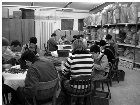
Die Arbeit in der neu eingerichteten Kräuterwerkstatt ist eine willkommene Abwechslung für die Mitarbeiter.

Ein wohlthuender Geruch empfängt den Besucher in der Kräuterwerkstatt. Es riecht immer wieder nach anderen Kräutern – Zitronenmelisse, Salbei, Englische Minze, Kamille, Lavendel, Holunderblüten, Apfelmünze... Ein Duft, der aus der im Gebäude der Dorfmeisterei eingerichteten jüngsten Lautenbacher Werkstatt strömt.