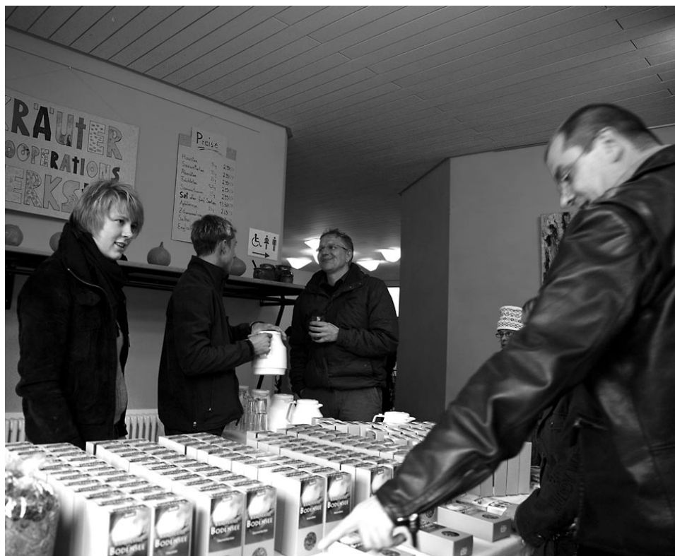
Der Verkaufsstand mit Produkten aus der Kräuterwerkstatt samt Teeverkostung erwies sich beim Herbstmarkt als Publikumsmagnet und stieß auf sehr großes Interesse.